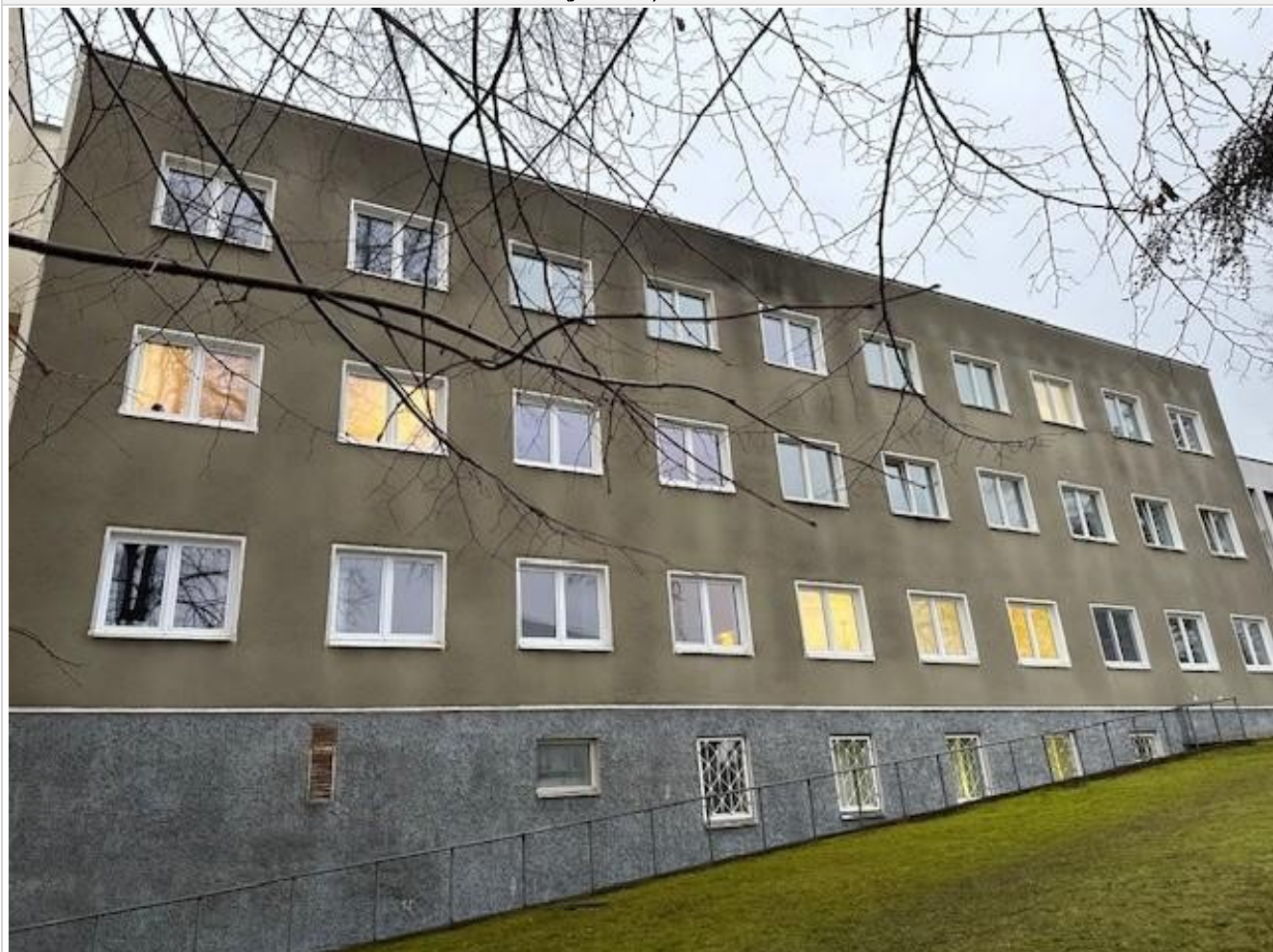
Pastato (jo dalies) fotonuotrauka

Pastatų energinio naudingumo sertifikavimo ekspertas